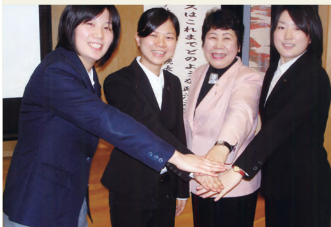
次代へパワーアップ……。