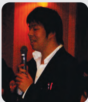
発言の機会を得ました

さる2月26日大阪府看護連盟主催の看護学生と新入会員を対象にした講演会が開催されました。