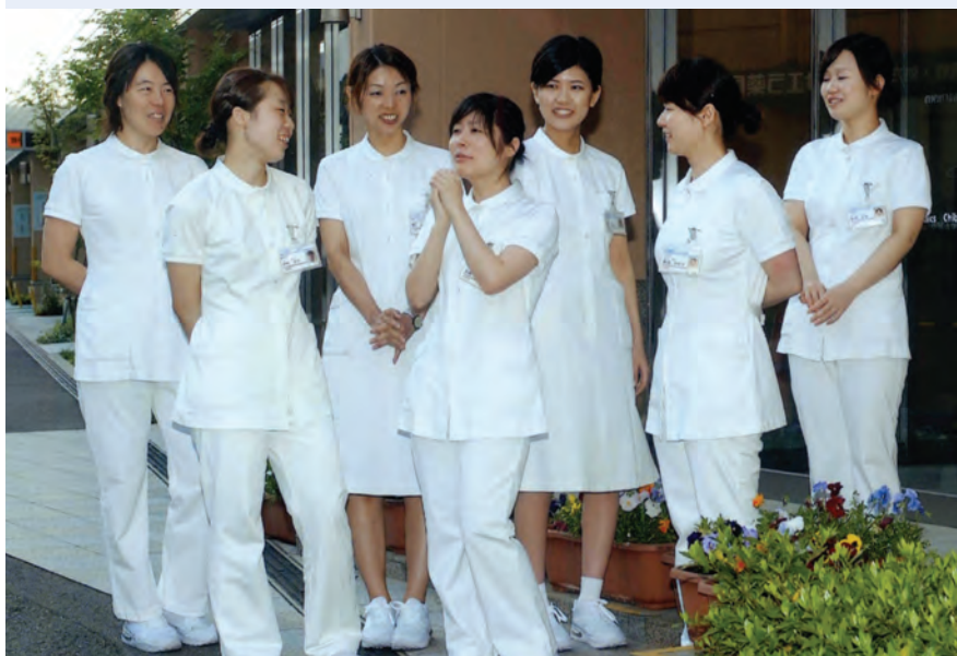
お母さんと赤ちゃんが元気に育っていきますように！