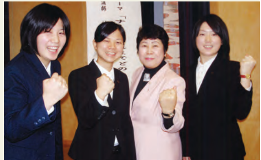
未来に向かってガッツ!

今後私は、看護専門学校を卒業し大学に編入します。様々な角度から現状を学び、広い視野を持ちより多くの知識を身につけていきたいです。