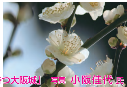
「春を待つ大阪城」