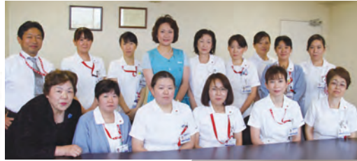
〈施設訪問で 歓迎を受けました〉