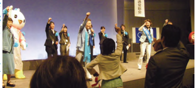
がんばろうコールで 「ガンバリ」