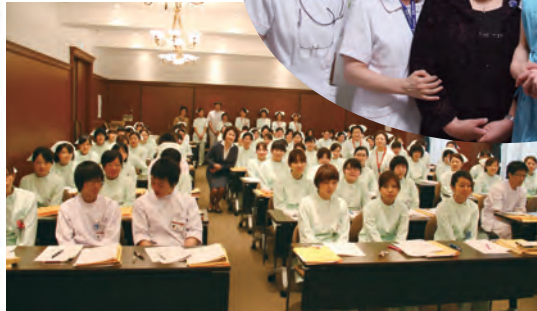
新人研修へ 飛び込み