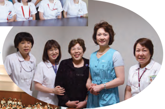
なごやかに 温かく…。