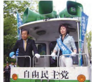
イザ出発(街宣車にて)