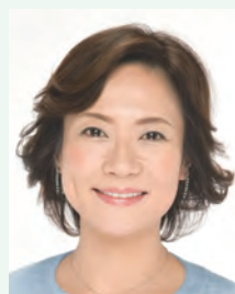
参議院議員 高階恵美子