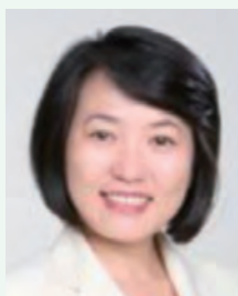
衆議院議員 あべ 俊子

大阪府看護連盟の皆様、新年あけましておめでとうございます。いつも温かいご支援を賜り、心より感謝申し上げます。また昨年の参院選では皆様の多大なるご尽力のおかげさまで、たかがい恵美子議員という心強い同士を得ることができました。