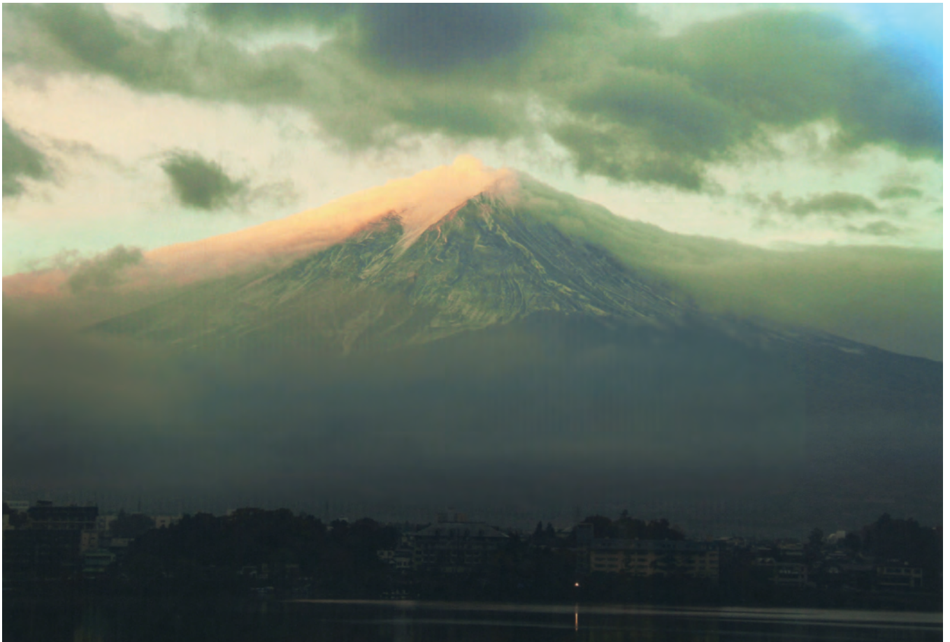
「躍動」(日の出を待つ富士)